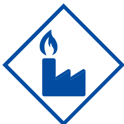
Energieerzeugung/ Fossile Brennstoffe

Ausschluss von Maßnahmen im Zusammenhang mit fossilen Brennstoffen, die für die Energieerzeugung als nicht sinnvoll erachtet werden (u. a. in den Bereichen Atomkraft, Öl und Gas)