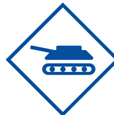
Verteidigungs- und Waffenindustrie

Ausschluss von Maßnahmen im Zusammenhang mit bestimmten Substanzen (u. a. gesundheitsschädlich, ozonschädlich) sowie Bioziden, radioaktivem Material etc.