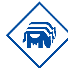
Kontroversen in den Bereichen Umwelt, Natur und Lebewesen

Ausschluss von Geschäftsbeziehungen zu Unternehmen der Waffenindustrie (u. a. Herstellung, Handel und Transport kontroverser Waffen)